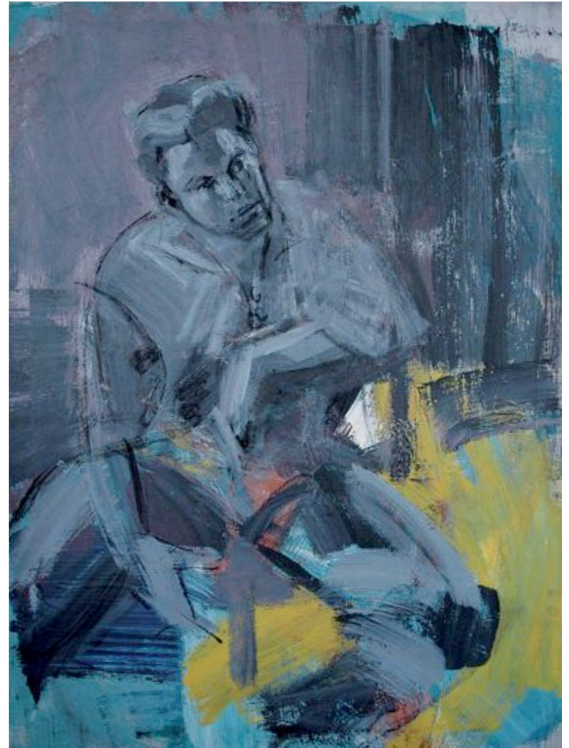
Sitzender, 1995 Acryl und Kohle auf Leinwand 120 x 90 cm