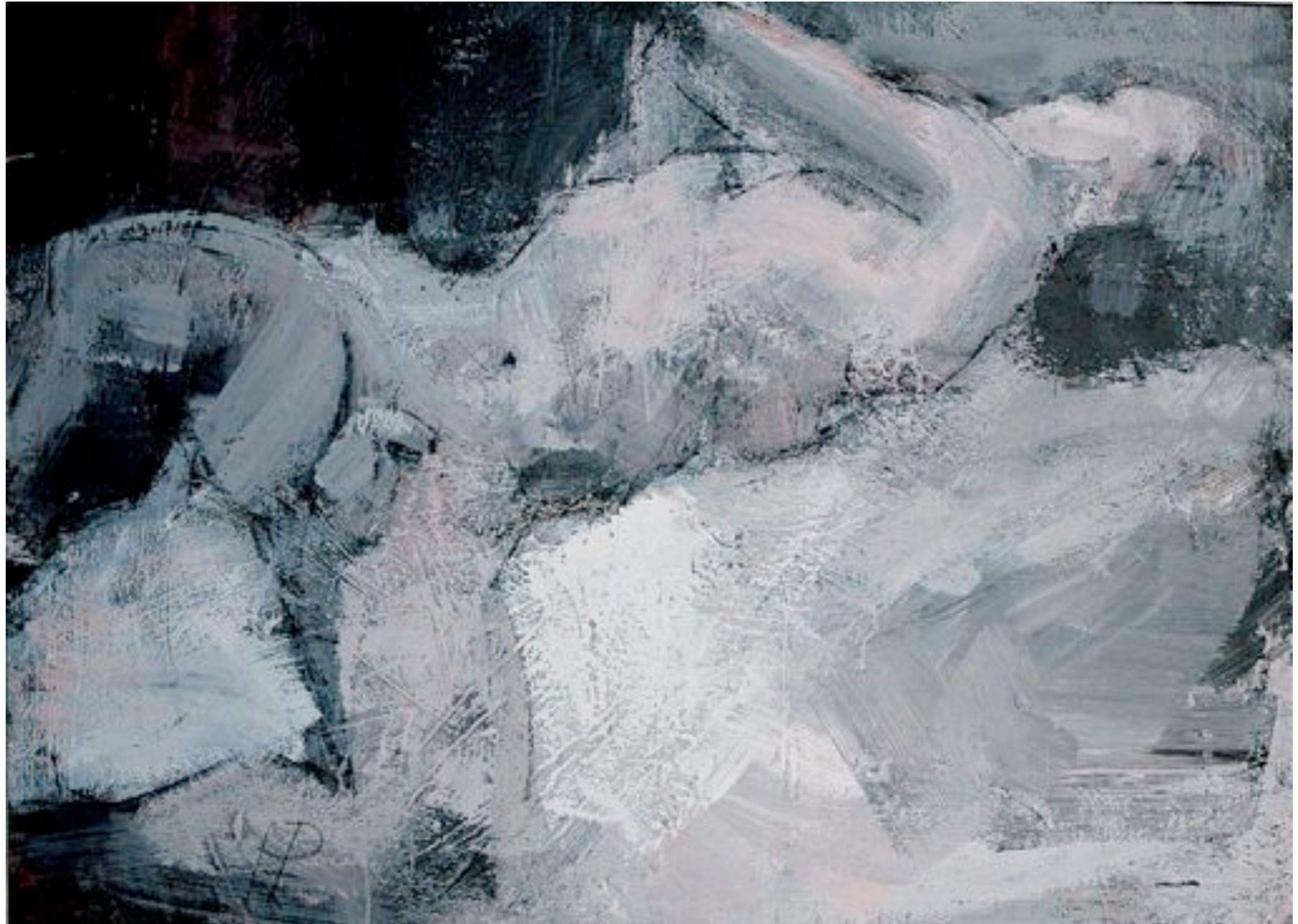
Traumumfängen, Acryl und Kohle auf Leinwand, 90 x 120 cm