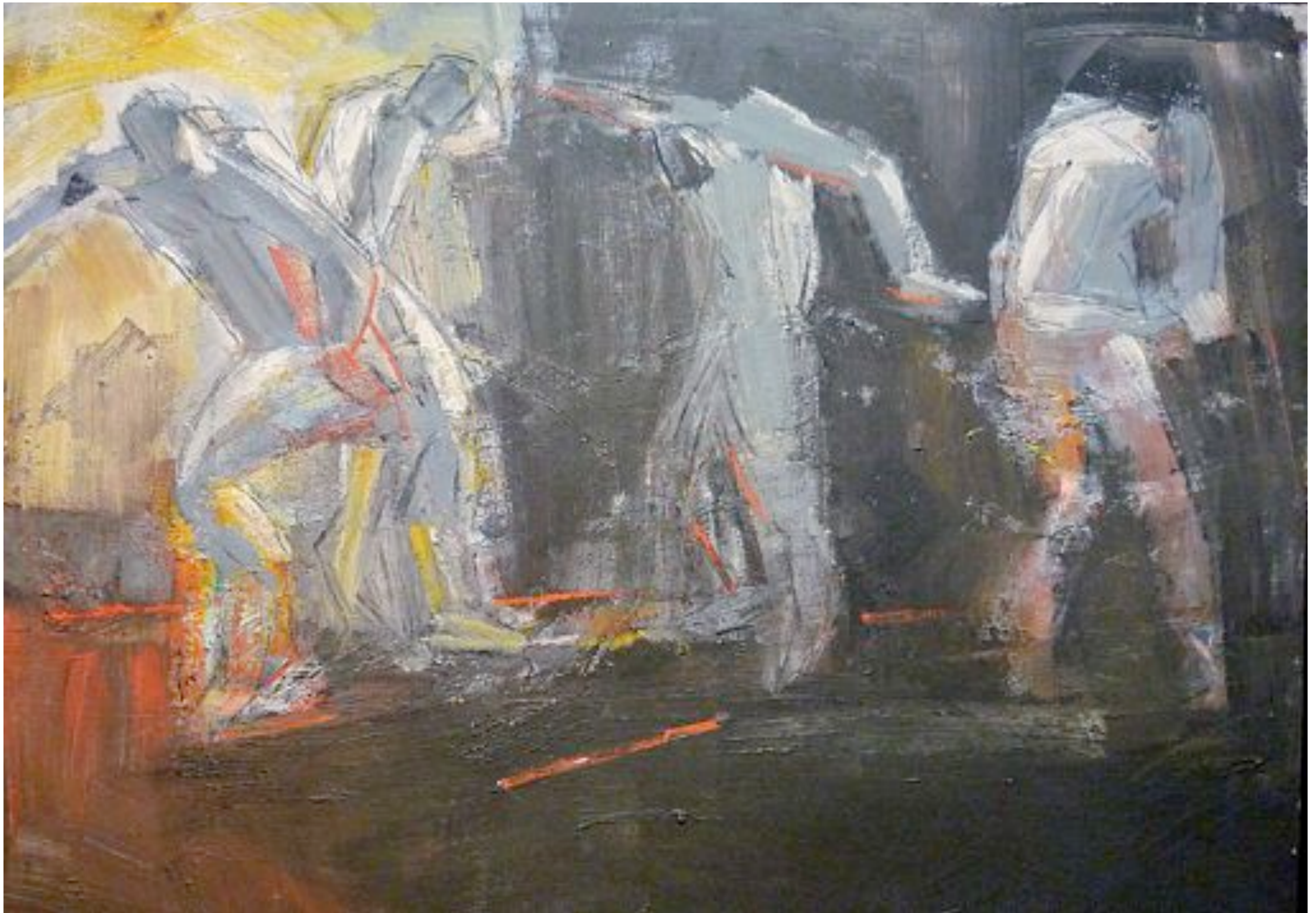
Die Tänzer 1993, Acryl und Kohle auf Leinwand, 135 x 160 cm