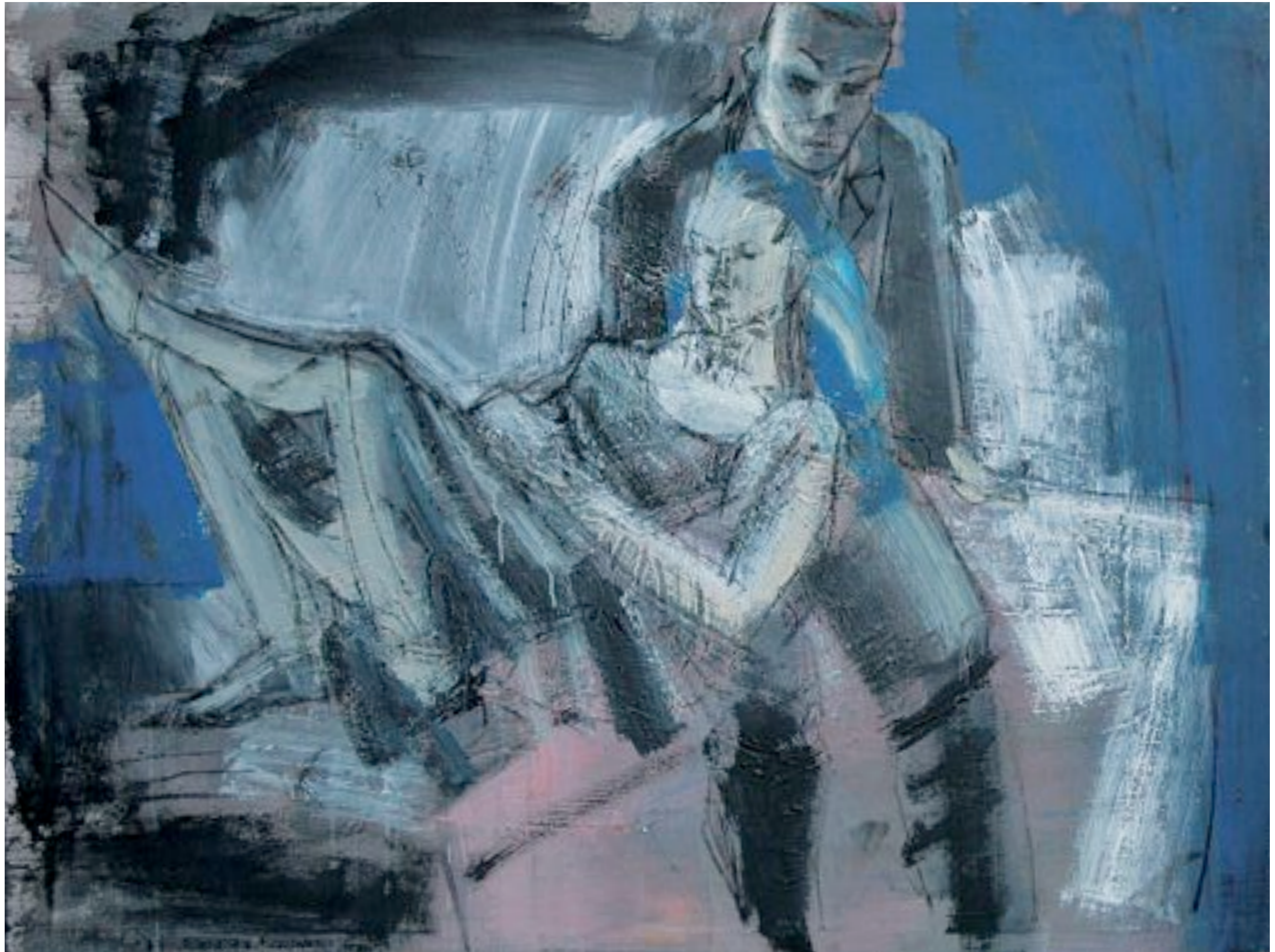
Liebespaar, 1992, Acryl und Kohle auf Leinwand, 104 x 139 cm