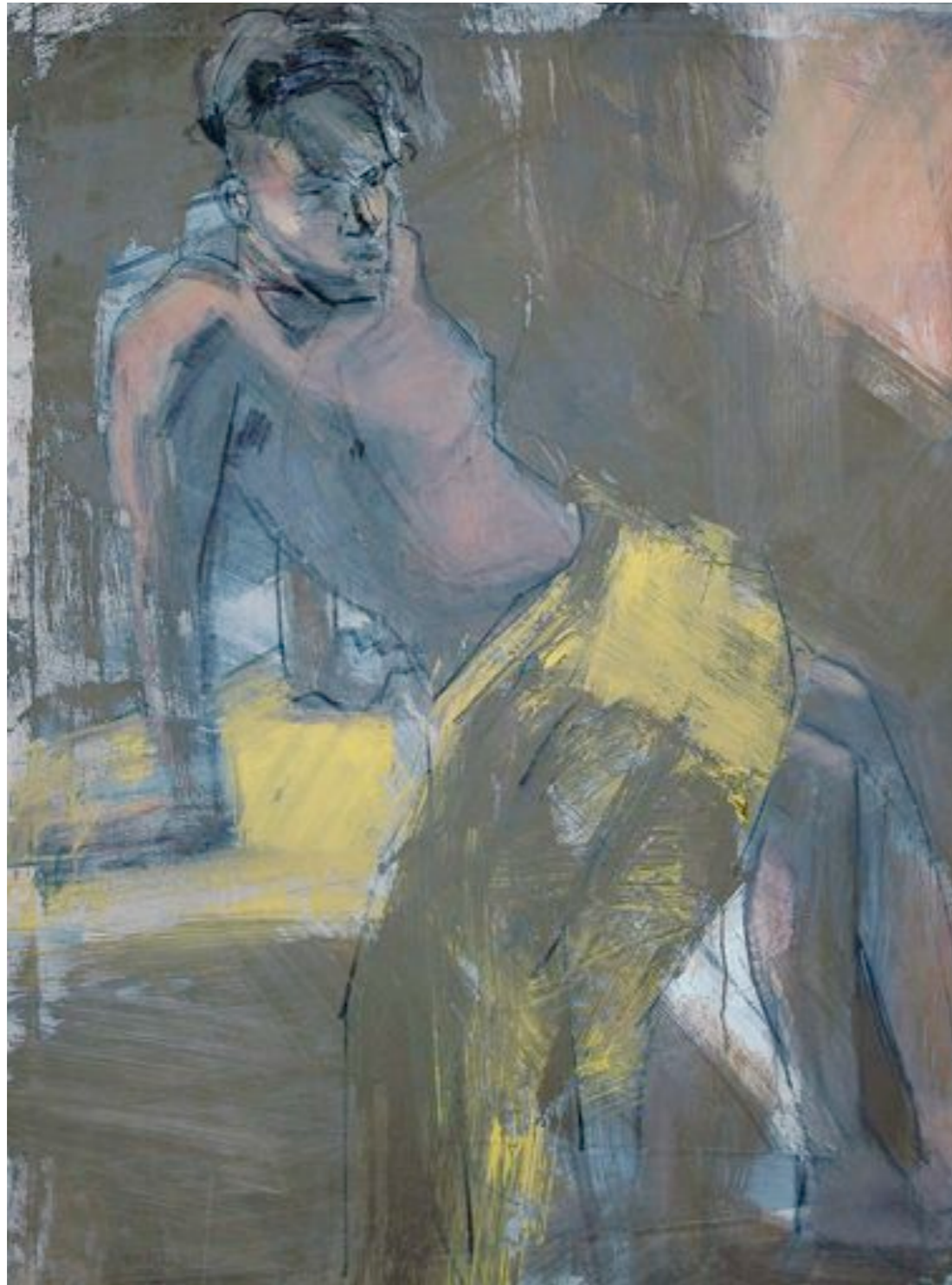
Modell im Atelier Acryl und Kohle auf Leinwand 140 x 100 cm