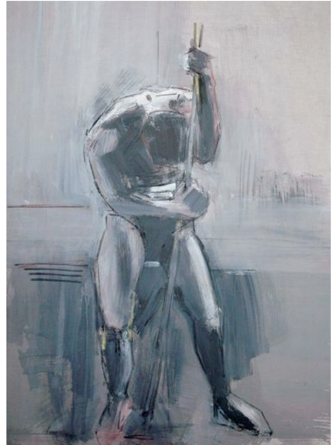
Die Bürde Acryl und Kohle auf Leinwand 120 x 90 cm