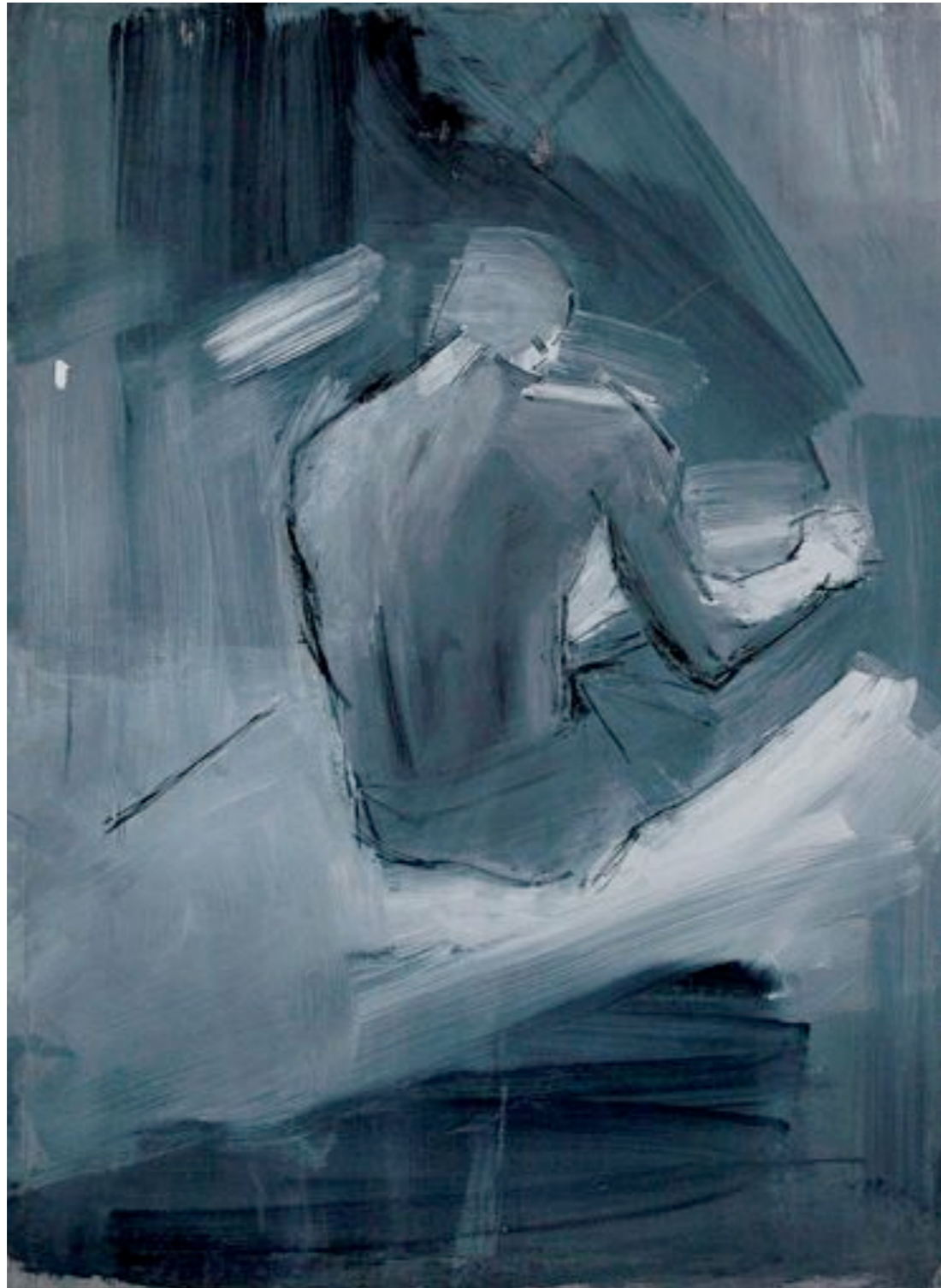
Vor der Entscheidung Acryl und Kohle auf Leinwand 120 x 90 cm